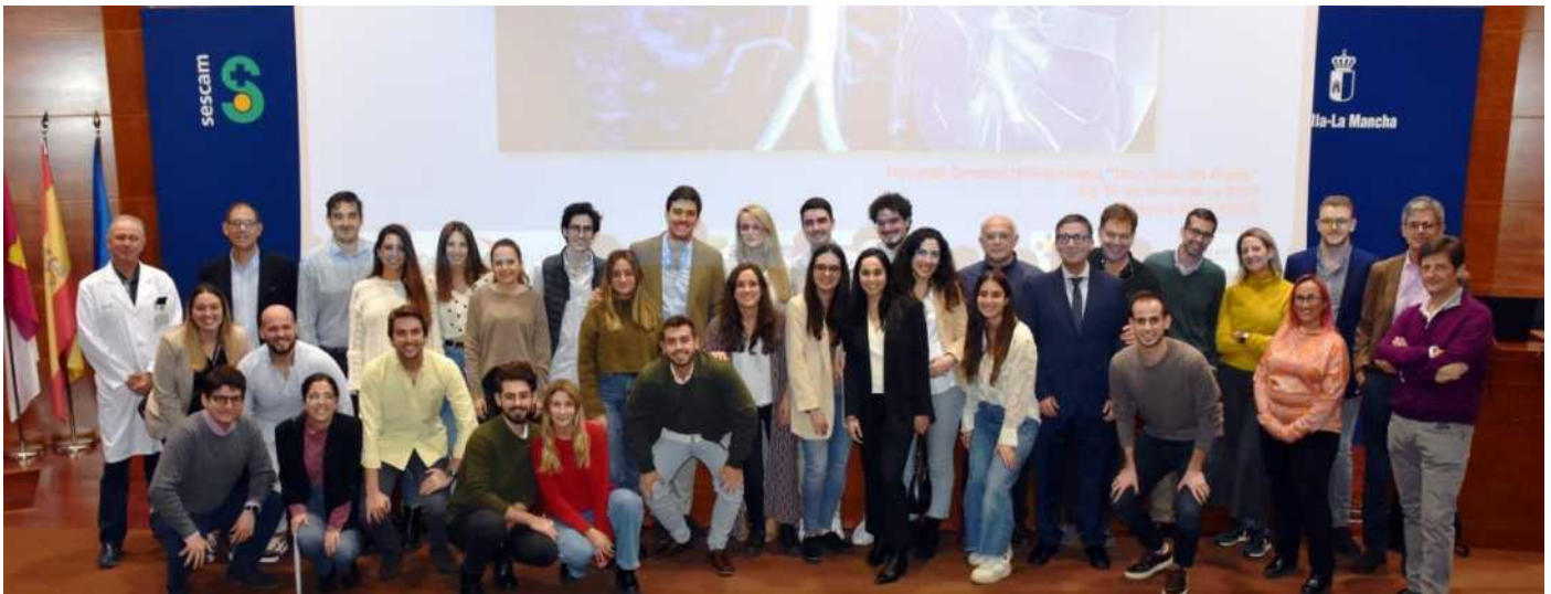
Nuestro Hospital ha acogido la celebración de la XII Reunión de los residentes de la especialidad de Urología de Castilla-La Mancha, en la que se han dado cita entorno a medio centenar de profesionales. Felicidades a los organizadores.