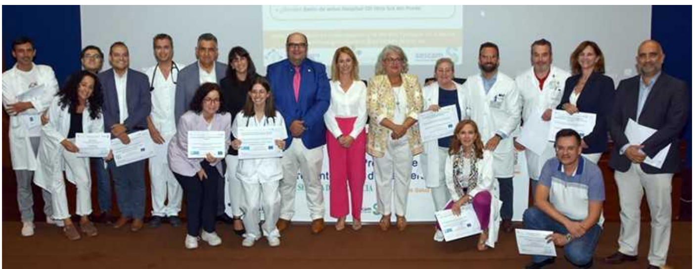
Los XI Premios de Investigación de la Gerencia de Atención Integrada de Talavera de la Reina han confirmado la calidad en este terreno de los trabajos de los profesionales.