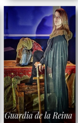
Guardia de la Reina