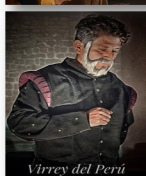
Virrey del Perú