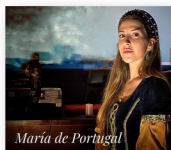
María de Portugal