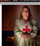
Priora de Glosa