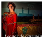
Leonor de Guzmán