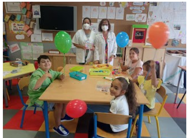
Comienzo de curso 2022-2023

Y por supuesto nuestro mayor agradecimiento para los niños y niñas que han pasado por el cole del Hospital durante estos veinte años. Cada año han ido pasando unos 200, habiendo disminuido algo esta cifra con la pandemia. En total unos 3500, que han hecho que valoremos su fortaleza y de los que hemos aprendido un montón.